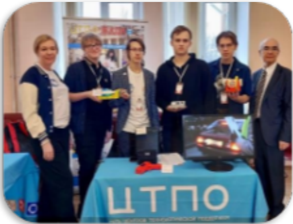
Всероссийские и региональные инженерно-технические конкурсы