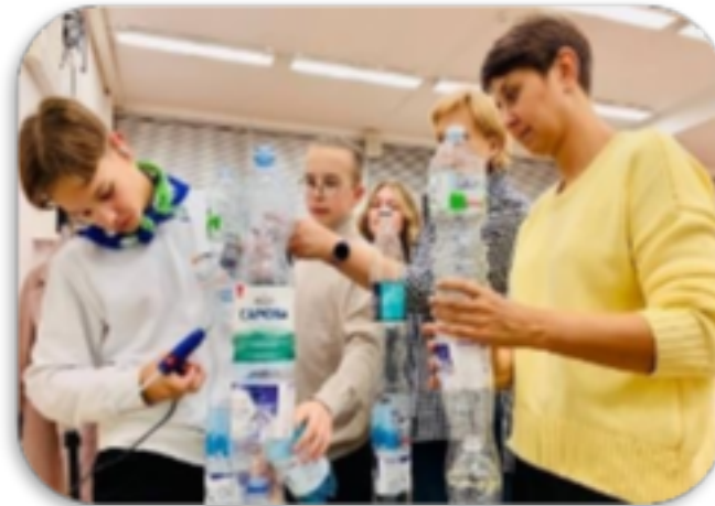
Движение «Юннаты.Первых» и команда «Юннатский факультет»

Наша целевая аудитория — это дети, молодежь от 6 до 25 лет, родители, педагоги и преподаватели.