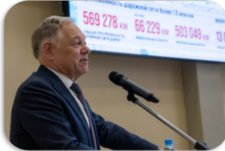
Публичные лекции главы ГК АВТОДОР В.П. Петушенко