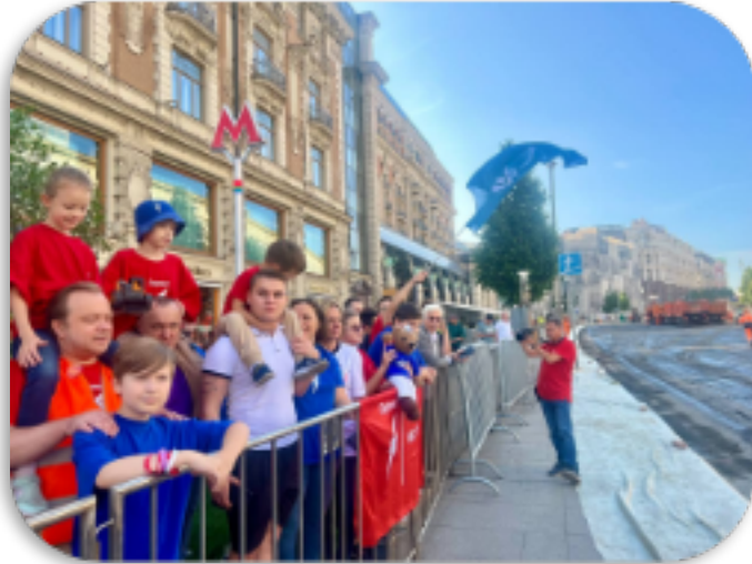
Семейные посещения значимых событий индустриальных партнеров