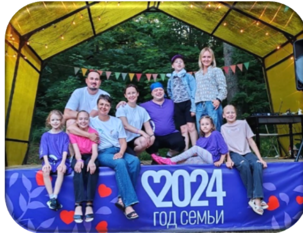
Семейное сообщество «Родные-Любимые.Москва»