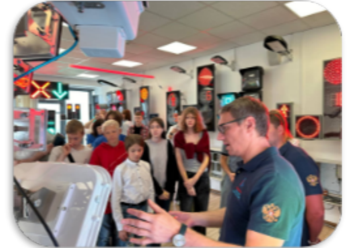
Проект «Университетские субботы»