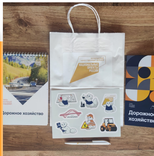
Разработка брендированных материалов