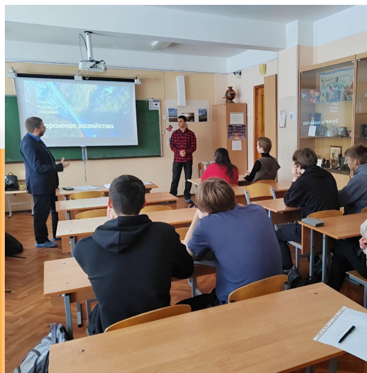
Профориентационные мероприятия в школах