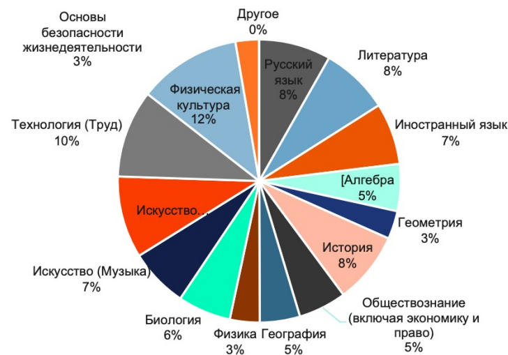
Распределение по учебным интересам 5-7 классов

Введение большего внимания на развитии практических навыков и формирование личного плана уроков может способствовать развитию интереса к изучению как базовых, так и дополнительных дисциплин школьниками.