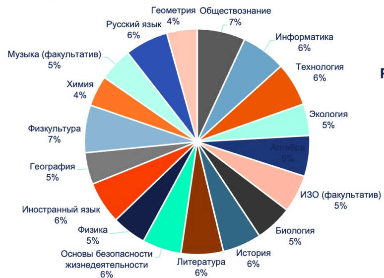
Распределение по учебным интересам 8-11 классов